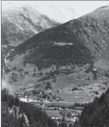
Uitzicht over Reckingen

Er wordt wel eens gezegd: wie gaat er nu elk jaar naar de zelfde plek op vakantie? Zo wordt er ook wel eens gezegd: als je een goede plek hebt moet je hem vasthouden! Weer anderen zeggen met ons: 't is een soort heimwee dat ons trekt. Het is immers elke keer weer anders!