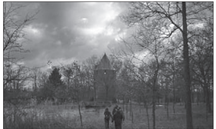
Op de 40 km-route passeerden de wandelaars De Tomp, die stamt uit 1330. De toren staat op domein 'De Lange Els', een landgoed dat speciaal voor OLAT werd opengesteld. De Tomp is van oorsprong een burcht.

De verzorgingsposten hadden het meeste last van het stormachtige en natte weer. De eerste post kon niet worden opgezet omdat de vrachtwagen zou blijven steken in de modder en de gekozen plek op de hei totaal onbeschermt was; de laatste post kon alleen met doortastend optreden van de 'bemanning' aan de grond gehouden worden.