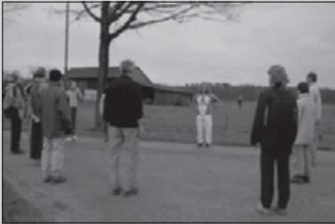
Gasttrainer in Wintelre 13

CLUBBLAD VAN WSV OLAT • JAARGANG 33 • NUMMER 2 • FEBRUARI 2007