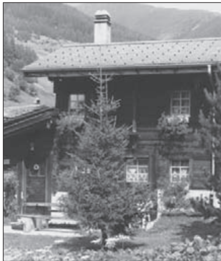
Woonhuis in Bodmen

En of het nu over 'der Sieg der Walliser über die Berner in 1211' gaat of om de Berner, die zowel in 1212 als in 1419 het dorp Obergesteln hebben gebrandschat, de verschrikkelijke lawines, die delen van dorpen hebben weggevaagd, overal is wel iets over de veel bewogen geschiedenis te lezen.