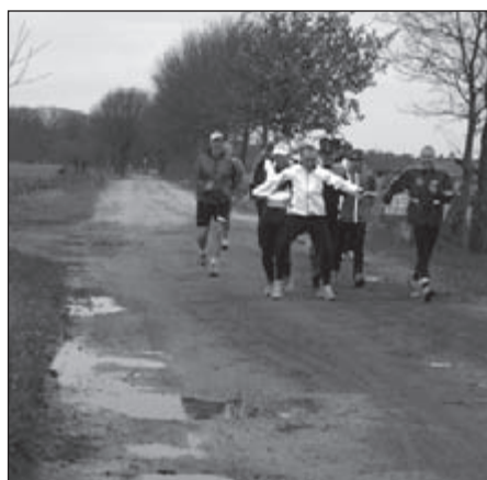
Een beetje dollen tijdens de groepstraining in het buitengebied van Wintelre

Nog afgezien van de punten die ermee te verdienen zijn, valt het samenstellen van een persoonlijk jaarprogramma niet mee. Er zijn 'maar' 52 weekenden en er is veel overlap. „Soms wel vier tochten per weekend, en je wilt ze allemaal een keer gelopen hebben.” Carry: