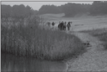
Grenzeloze Tocht 20-21