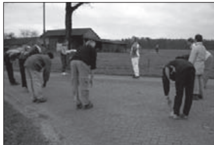
Spijeren losmaken voor het echte werk begint