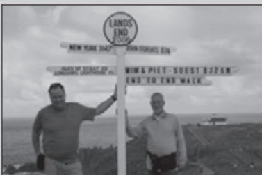
Land's End naar John O'Groats 26-30

Soms moesten de winterserie-wandelaars over een omgewaaide boom heen, soms eronderdoor