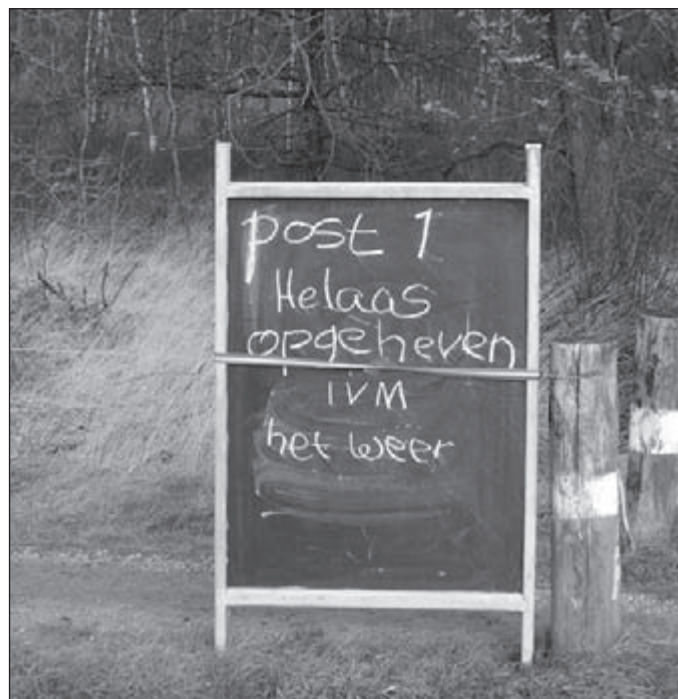
Modder en storm speelden de verzorging parten in Soerendonk