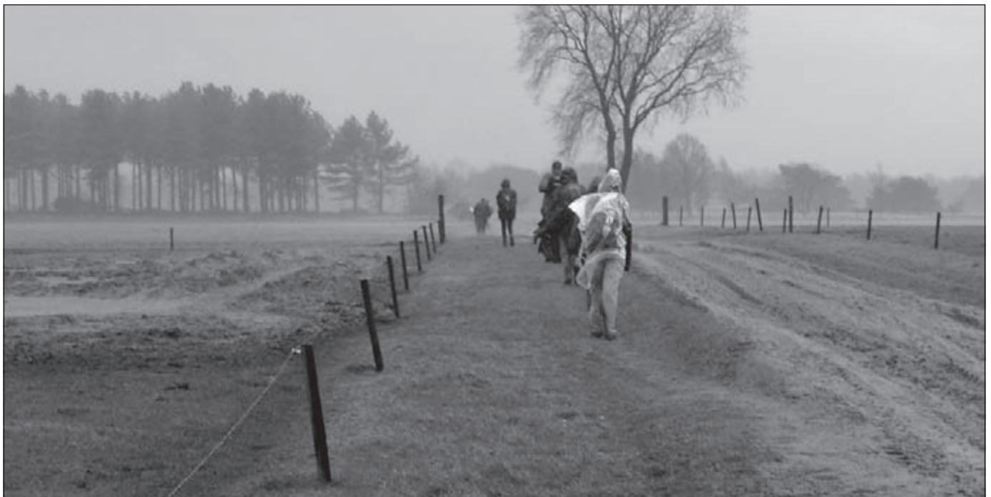
Tegen de middag werd het droog, maar een paar uurtjes later moesten de regencapes weer tevoorschijn worden gehaald.